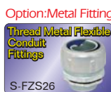
Option: Metal Fittings Thread Metal Flexible Conduit Fittings S-FZS26