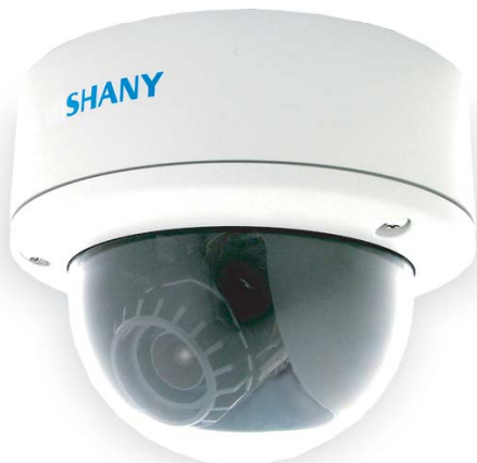
3軸自由任意旋轉 (3軸)