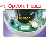
Option: Heater Heater